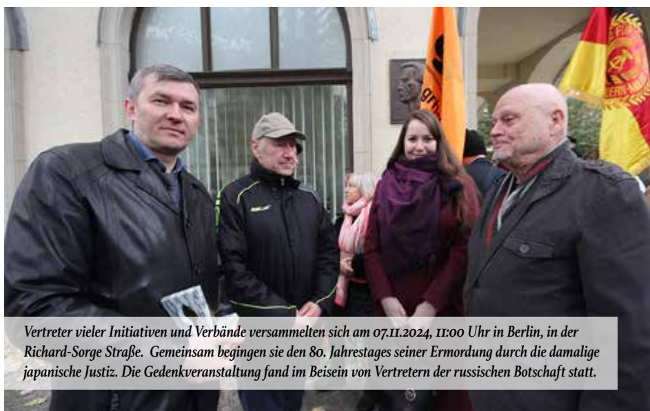
Vertreter vieler Initiativen und Verbände versammelten sich am 07.11.2024, 11:00 Uhr in Berlin, in der Richard-Sorge Straße. Gemeinsam begingen sie den 80. Jahrestages seiner Ermordung durch die damalige japanische Justiz. Die Gedenkveranstaltung fand im Beisein von Vertretern der russischen Botschaft statt.

tionen nach Moskau. Seine wichtigste Botschaft war das Datum des geplanten deutschen Überfalls auf die Sowjetunion, was allerdings seitens der sowjetischen Staatsführung nicht ernst genommen wurde. Sorge gilt als »roter Superspion«. Dabei wird zumeist ausgeblendet, dass er lange vor seiner Spionagetätigkeit in der kommunistischen Bewegung tätig war.