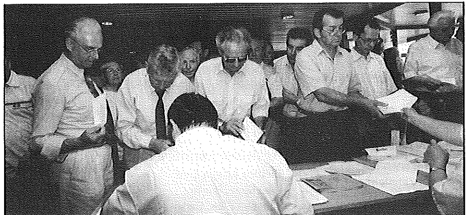
Anmeldung der gewählten Vertreter